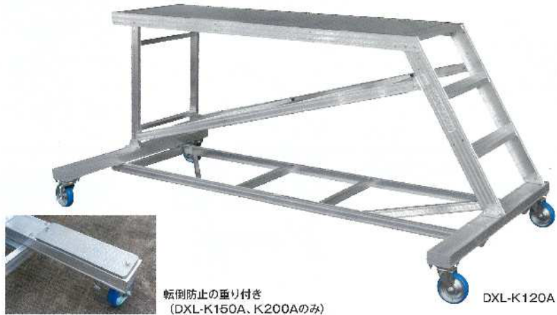
転倒防止の垂り付き (DXL-K150A、K200Aのみ)