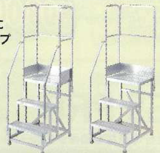
DB3-649 +フルセット手すり

作業内容に合わせて 様々なタイプの 手すりをラインナップ。 詳しくはお問い合わせください。