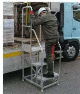
DB3-649+ DB2.0-T3W110 (両側手すり)